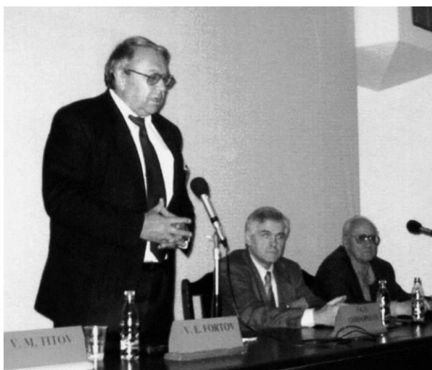
EPNM-2006, г. Москва

по ударно-волновым процессам, начатые еще в 1970-е гг. в Чехословакии. Начало возрождению было положено на VIII Международном симпозиуме EPNM (International Symposium on Explosive Production of New Materials) в Москве (2006 г.).