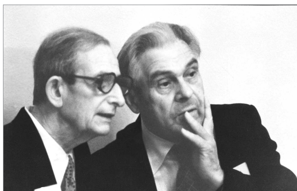
Академик АН СССР Ю. Б. Харитон и член-корреспондент АН СССР Ф. И. Дубовицкий

кинетические исследования с участием Г. Б. Манелиса, Ю. И. Рубцова, Г. М. Назина, А. Г. Мержанова, В. Г. Абрамова, В. В. Барзыкина, Л. Т. Еременко привели к активному развитию химической физики горения и взрыва, способствовали внедрению новых мощных ВВ в практику.